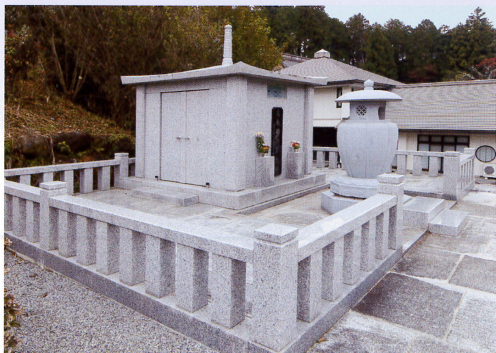
永代供養墓「安穩廟」

この廟はお墓のない方や墓があっても祭祀承継者がなく、将来に不安を感じている方に安心を資するための合葬用墓地です。