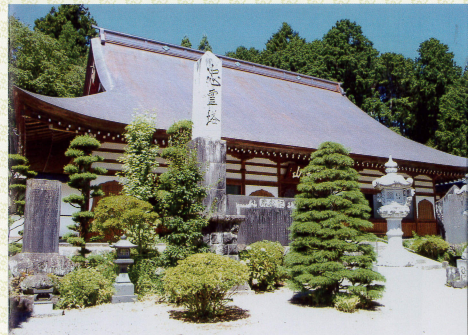
本堂 文政2年建立、平成24年7月20日改修竣工